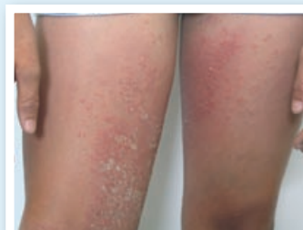
kontaktní alergický ekzém